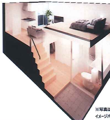
※写真は内観イメージベースです