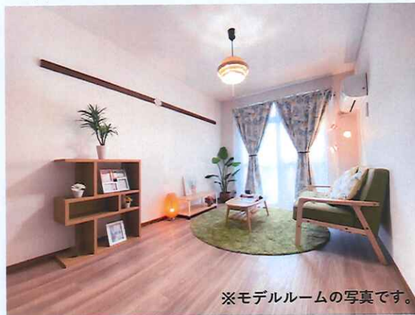
※モデルルームの写真です。